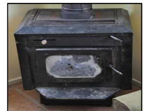
Estufas a leña ineficientes. Tiraje cerrado

ALTOS ÍNDICES DE CONTAMINACIÓN DEL AIRE POR MATERIAL PARTÍCULADO MP10 Y MP2,5