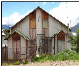
Deficiente aislación térmica en viviendas

Además, el uso de la leña , mayormente húmeda, y la utilización de equipos de combustión poco eficientes y no certificados (salamandras, artefactos hechizos, calefactores de cámara simple, otros), su baja frecuencia de limpieza y mantención, y el inadecuado control de oxígeno de éstos (tiraje de aire cerrado), es que finalmente se generan Altas Emisiones de Material Particulado , que después nosotros respiramos, afectando nuestra salud y la de nuestros hijos(as).